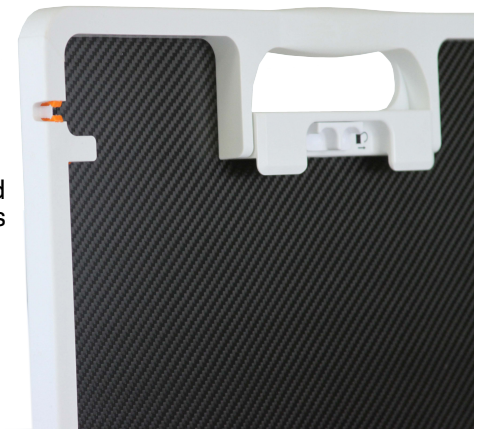
Fits most tethered DR panels