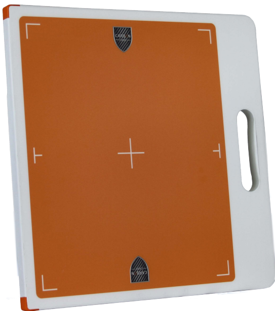
Ergonomic handle available on long or short axis